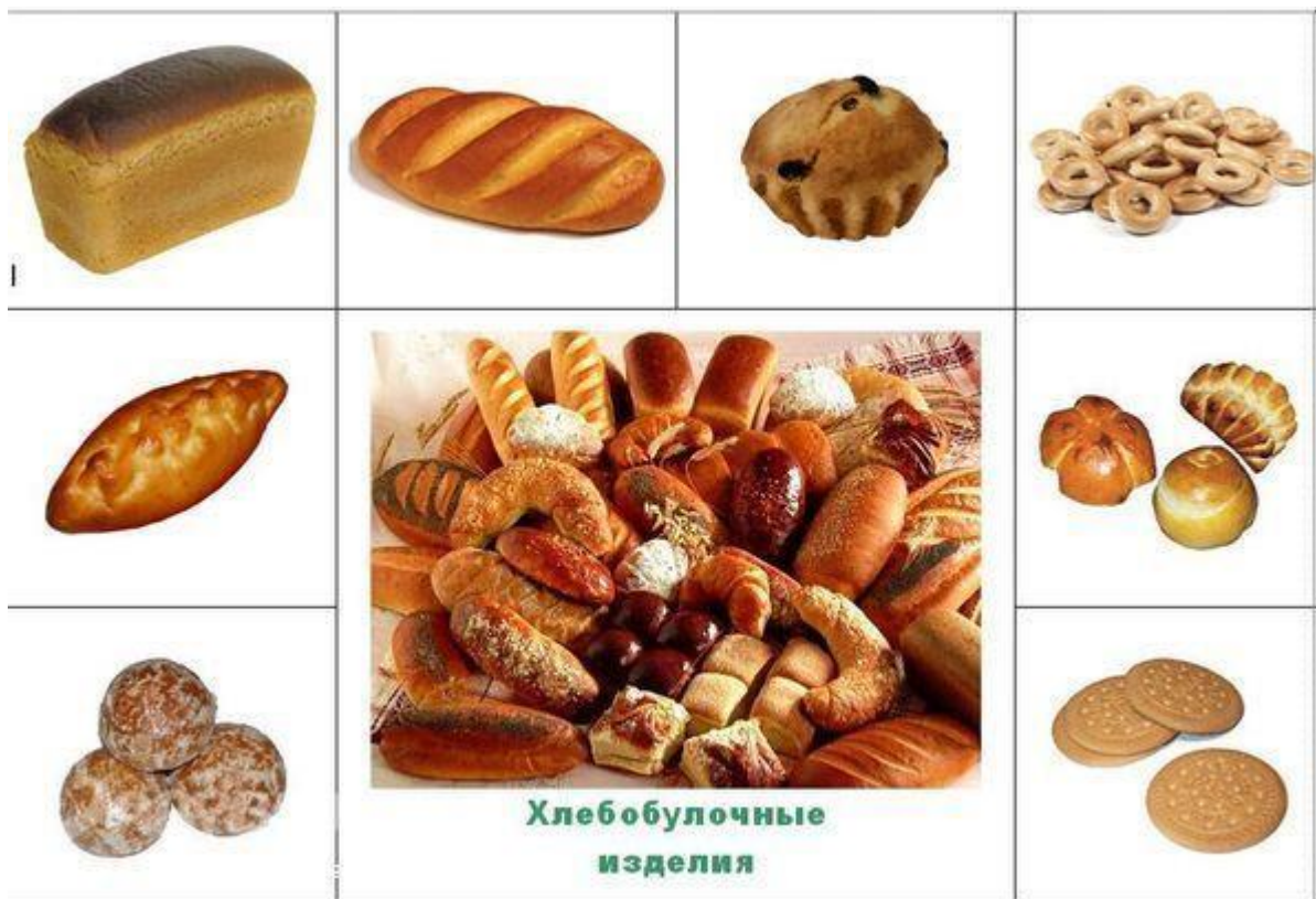
Приложение 2 (карточка для индивидуальной работы)